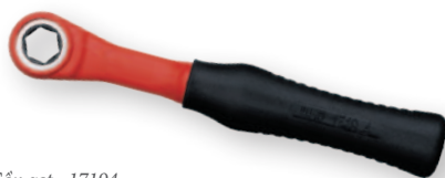
Cần gạt - 17194