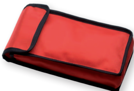
Túi mềm - AB6230